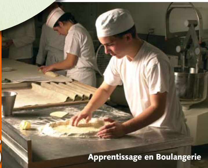
Apprentissage en Boulangerie