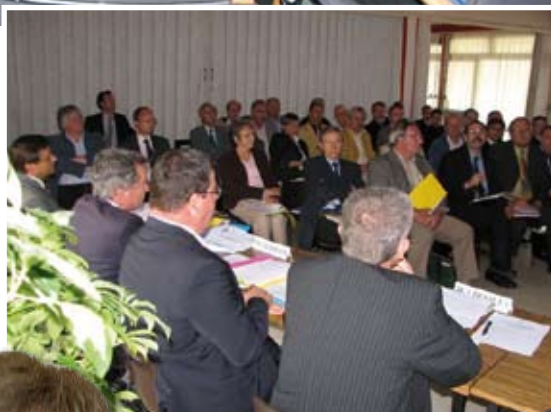
Les administrateurs se réunissent en AG 2 fois par an

Mon message ? Que les artisans prennent le temps de bien regarder les communications que nous faisons et les informations que nous leur divulguons ! C'est important pour eux ! Généralement, ils ne le font que lorsqu'ils ont un problème à résoudre... Constat analogue en ce qui concerne la légitimité de la CMA, dont les élus sont choisis seulement par les 20 % d'artisans qui prennent la peine de voter lors des élections... Moralité : on doit encore plus travailler sur la communication, pour faire venir les artisans à nous !».