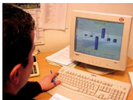
Apprentissage en BTS Comptabilité et Gestion des Organisations