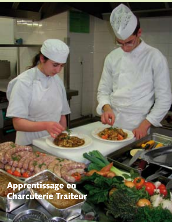
Apprentissage en Charcuterie Traiteur