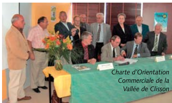
Charte d'Orientation Commerciale de la Vallée de Clisson