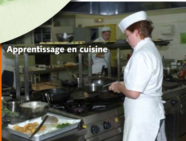
Apprentissage en cuisine

gnants, garder un œil et une oreille sur les évolutions du métier et rencontrer ses pairs» dit-il.