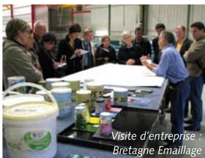
Visite d'entreprise : Bretagne Emailage

Longtemps considérés comme de piètres communicants, les artisans, d'une manière générale, ont dorénavant tout compris de l'intérêt de faire savoir ce que l'on sait bien faire. Nombreuses sont les entreprises à organiser des portes ouvertes, réaliser des plaquettes commerciales et disposer d'un site Internet, même si le bouche à oreille existe toujours ! Mieux, alors que l'individualisme a toujours été l'apanage des artisans, ils se sont mis à communiquer collectivement depuis presque 10 ans. Et quelle communication !