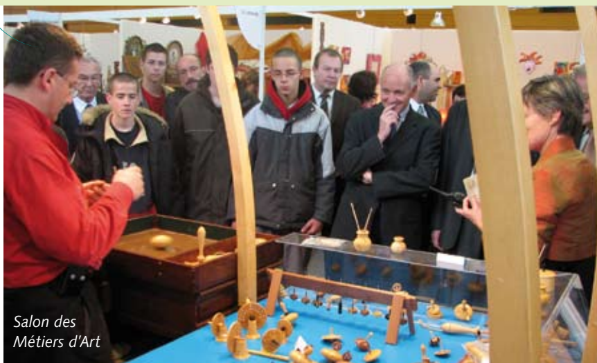
Salon des Métiers d'Art