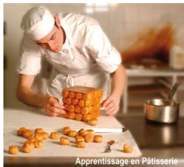
Apprentissage en Pâtisserie

de Brevet Technique des Métiers. «Il y a de l'avenir pour des jeunes motivés.» Parler d'avenir, c'est parler de se former à un métier que l'on aime, obtenir un diplôme national mais aussi parler d'emploi. «La Pâtisserie est un métier de passion. C'est aussi l'exercice de compétences diverses qui demande des bases dans tous les domaines d'enseignement général. L'un ne va pas sans l'autre ; créer des productions artistiques, comme dans le travail du chocolat et du sucre, mais aussi devenir un artisan qualifié et peut-être un jour un chef d'entreprise. Par l'apprentissage la formation permet d'allier le travail manuel et les connaissances d'une «tête» bien faite. Transmettre notre savoir-faire est un investissement quotidien et c'est un travail passionné que j'attends en retour.»