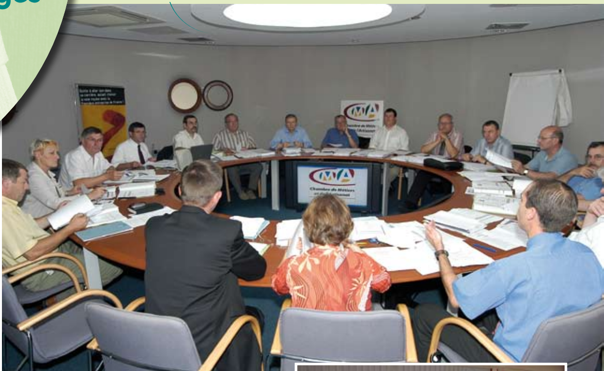
Le Bureau de la CMA se réunit tous les mois