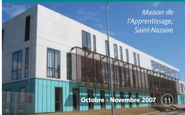
Maison de l'Apprentissage, Saint-Nazaire

«Les formations initiales en artisanat sont pilotées par l'Education Nationale, et les formations continues par les organisations professionnelles. Notre rôle est de veiller à ce qu'elles soient en adéquation avec les besoins des artisans. Un titulaire d'un BAC+2 ne doit pas repasser par un CAP classique pour devenir boucher ! Il lui faut une formation modulaire, adaptée à ses acquis et ses lacunes pratiques. Voici l'une des préconisations de la commission. Nous avons des missions clairement définies, mais pas toujours les moyens d'aller jusqu'au bout ! Pour plus d'efficacité, une réflexion de fond sur les besoins en formation des entreprises et des jeunes est nécessaire ; nous devons «décoder» les besoins souvent mal identifiés des artisans, pas seulement dans le domaine technique. Il faudrait par exemple combler le retard important en gestion informatique des professionnels de l'alimentaire par rapport à ceux du bâtiment !».